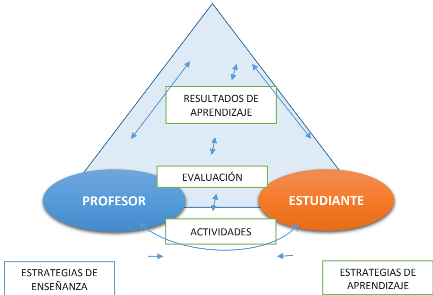
Figura 2. Modelo pedagógico.