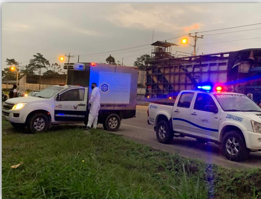
Anexo 2 Transporte apropiado