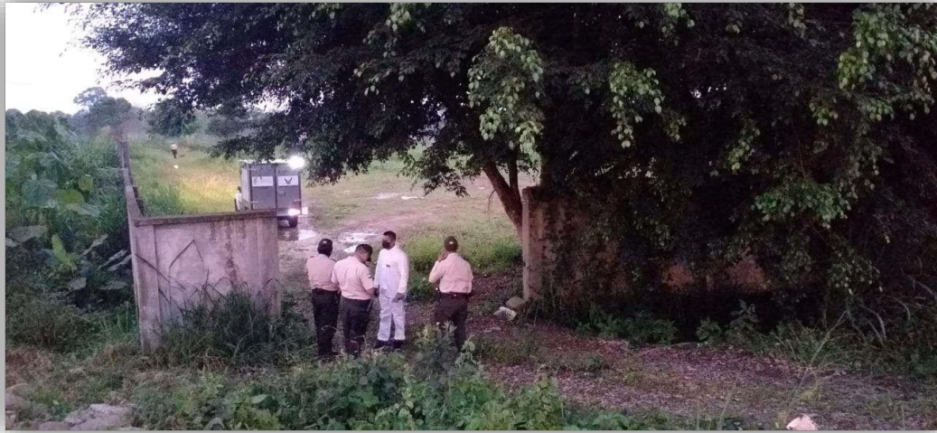
Anexo 1 Lugar donde se suscitó Caso Cristina