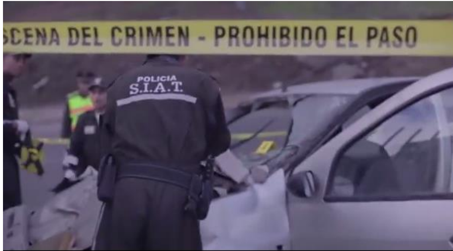
Gráfico 3 Observación general