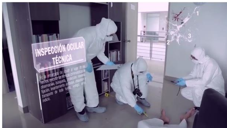
Gráfico 4 Observación Detallada