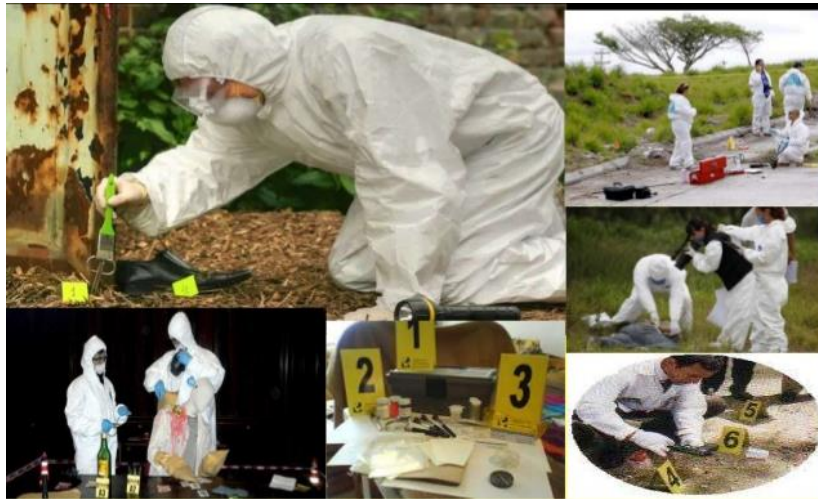
Gráfico 5 Observación detalladas del indicio