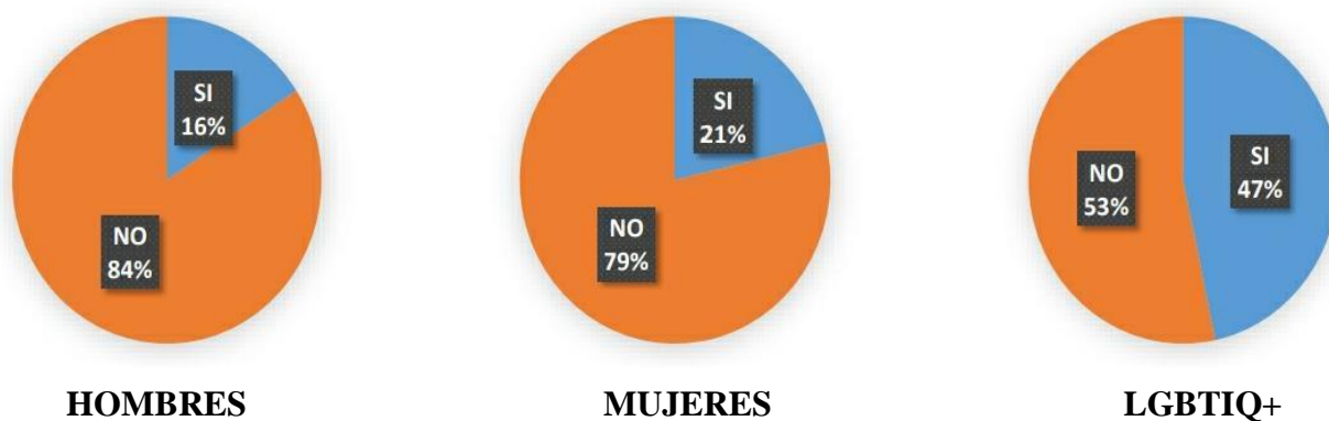
Figura 6: Violencia de género por manipulación de datos personales