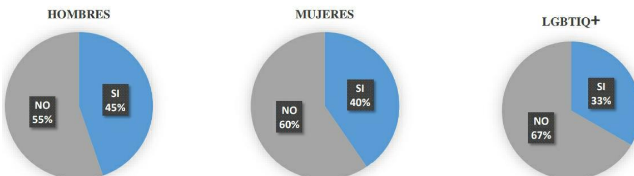
Figura 9. Eficacia de la norma constitucional