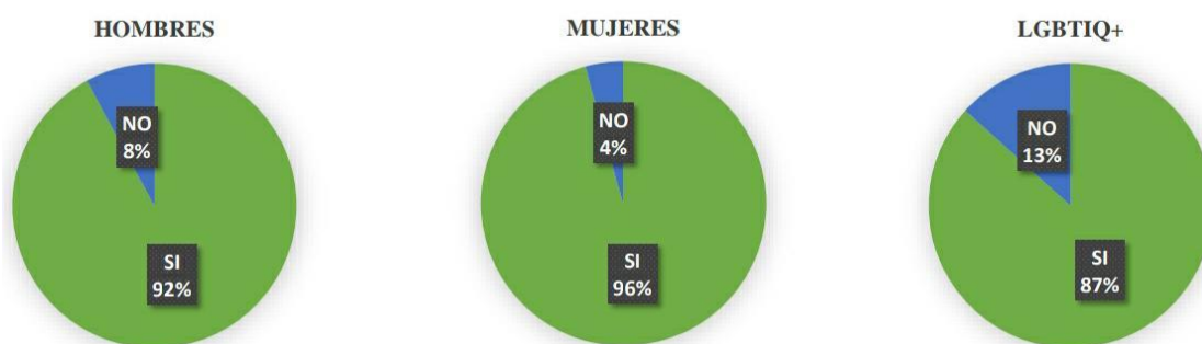
Figura 10: Posibilidad de interponer acción legal por violencia de género