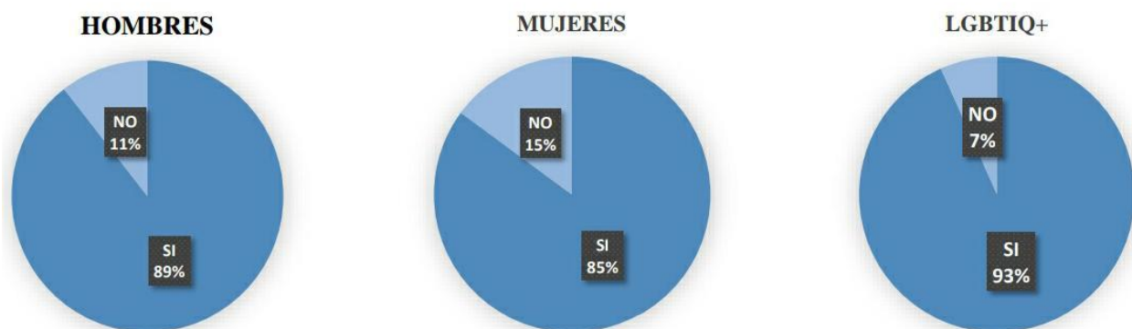
Figura 5: Posibilidad de violencia de genero por manipulación de datos personales