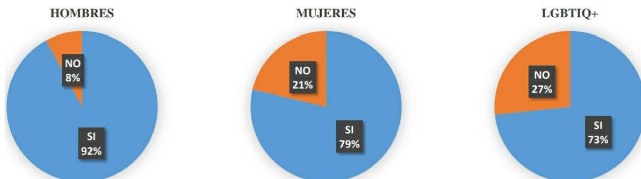
Figura 3: Derecho constitucional a la protección de datos personales