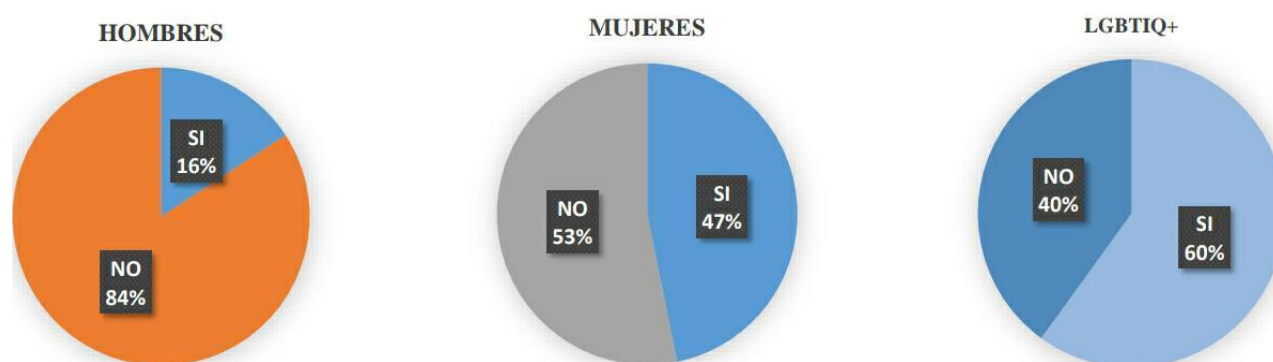
Figura 2: Posibilidad de ser víctima de violencia de género