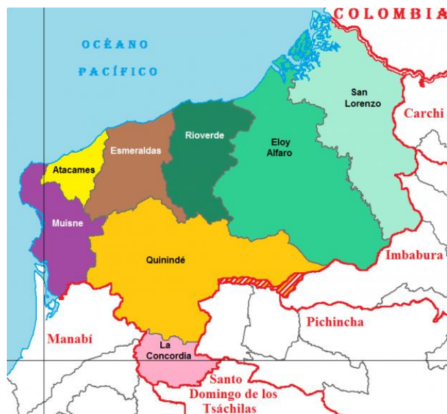
Figura 2. Mapa de Esmeraldas en el contexto ecuatoriano.