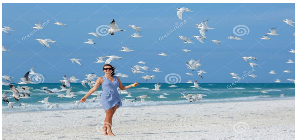
Imagen 1. La libertad de la mujer en el mundo actual.

Esa es la psicología de la mujer actual, no importa si guarda silencio frente a los atropellos de la pareja, esa es ya su manera de pensar y a veces le cuesta la vida, pero la lucha de otras sigue, pues si bien es cierto que la discriminación persiste en muchas naciones, y el machismo es difícil de erradicar, la evolución de los derechos femeninos es totalmente. Cada vez son más las mujeres empoderadas en todas las áreas del quehacer mundial.