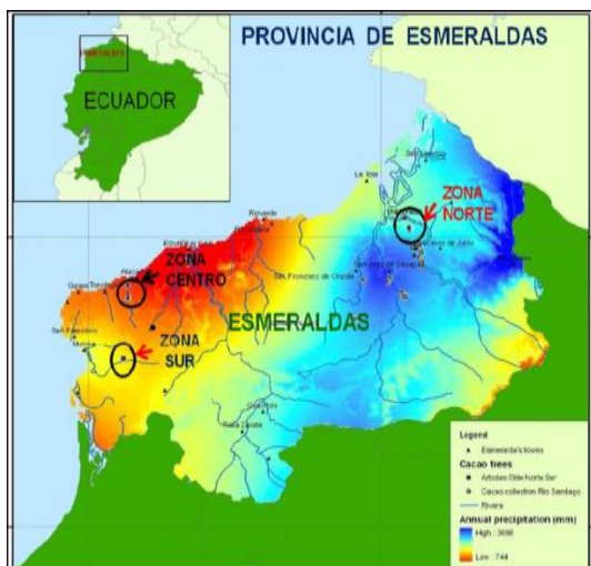
Figura 1. Mapa de ubicación de Esmeraldas en el contexto geográfico.

La provincia de Esmeraldas o provincia verde, como se le ha denominado durante siglos, forma parte importante del mapa de Ecuador, siendo ella una de sus 24 provincias. Geográficamente está situada en la denominada región litoral o de la costa.