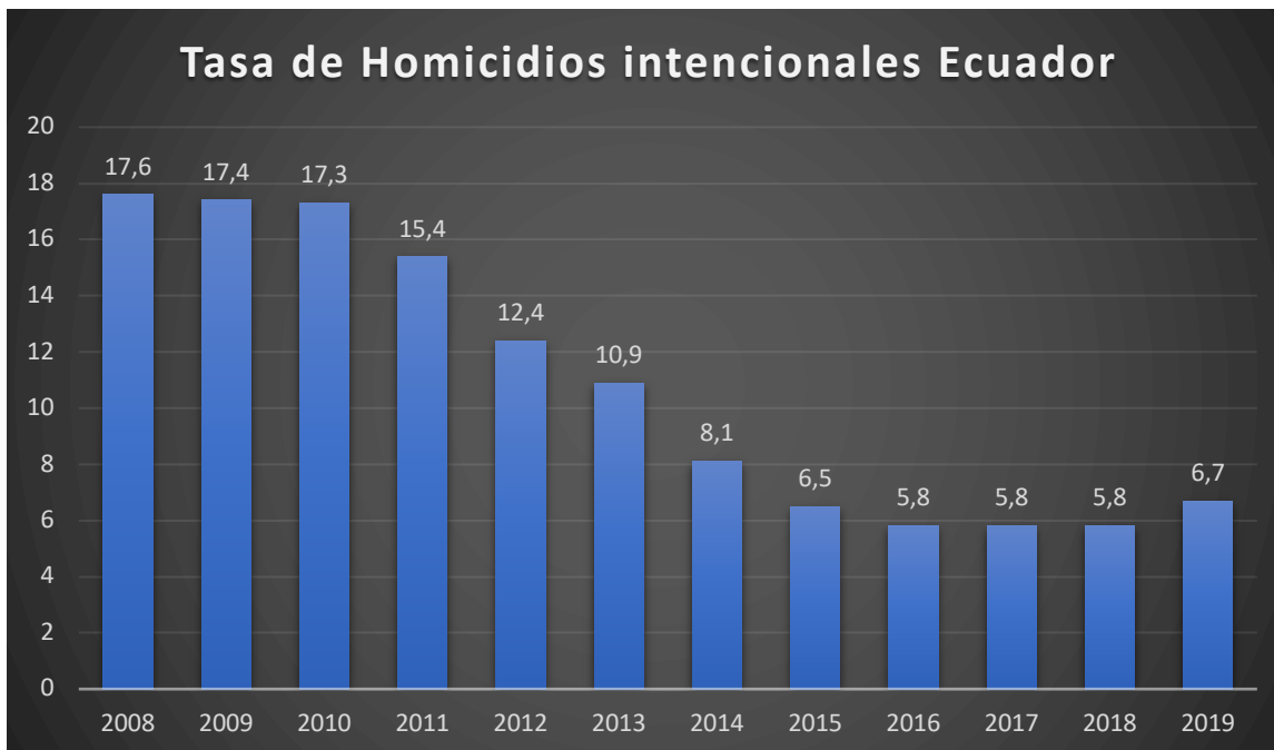
Figura 1. Tasa de Homicidios.

Asamblea Nacional, 2014), en los artículos, 140 Asesinato, 141 Femicidio, 143 Sicariato y 144 Homicidio. Los valores de los homicidios han ido variando durante el tiempo.