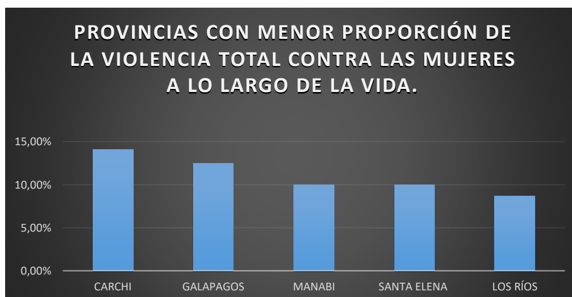
Gráfico N° 6