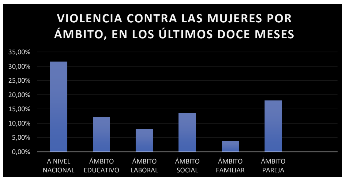
Gráfico N° 1