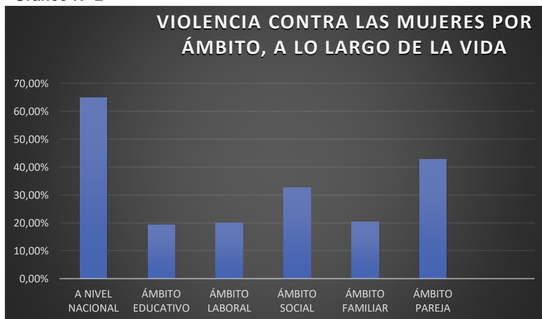
Gráfico N° 2