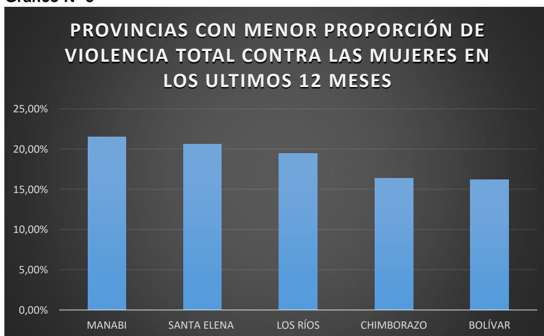
Gráfico N° 5