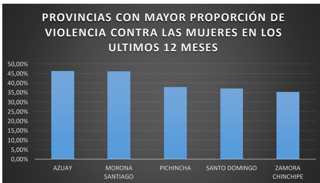
Gráfico N° 3